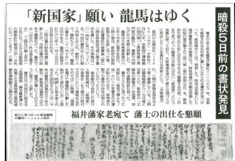
平成 29 年 1 月 13 日中日新聞より